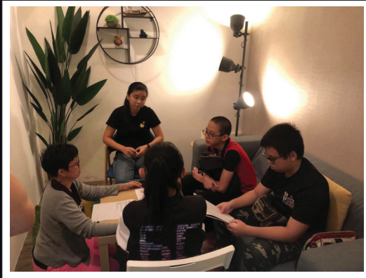
免费帮助单亲家庭