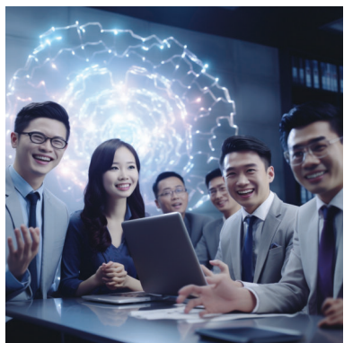
第二步 心智报告咨询 / 课程